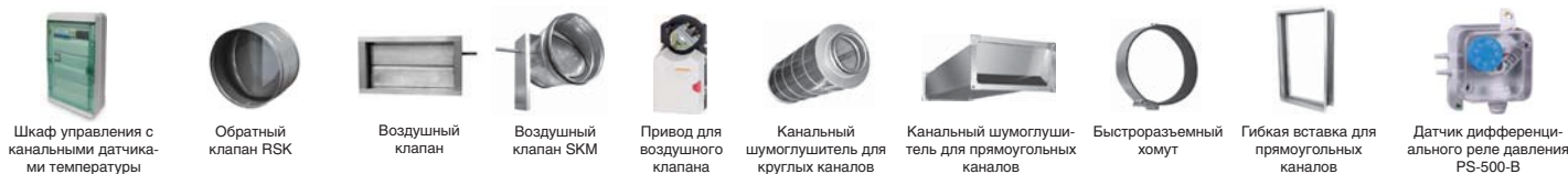
Шкаф управления с канальными датчиками температуры